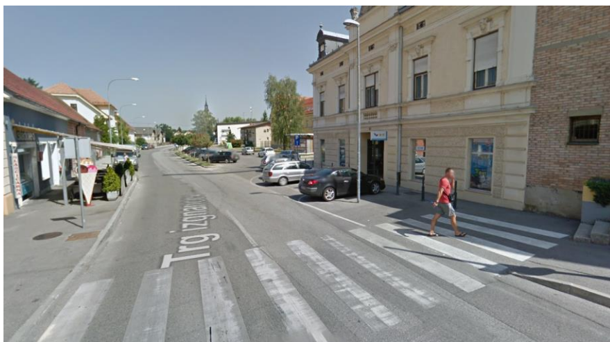
Slika 1: obstoječe stanje ceste – začetek trase

Določena prometna oprema in signalizacija je poškodovana in je potrebna zamenjave, prav tako pa je potrebno urediti novo prometno opremo in signalizacijo.